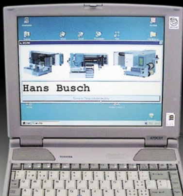
Zeicheneingabe am Computer ...